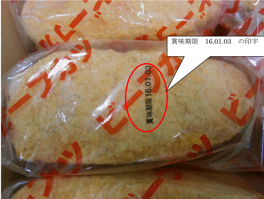
【当該ビーフカツ(16.01.03)の画像】